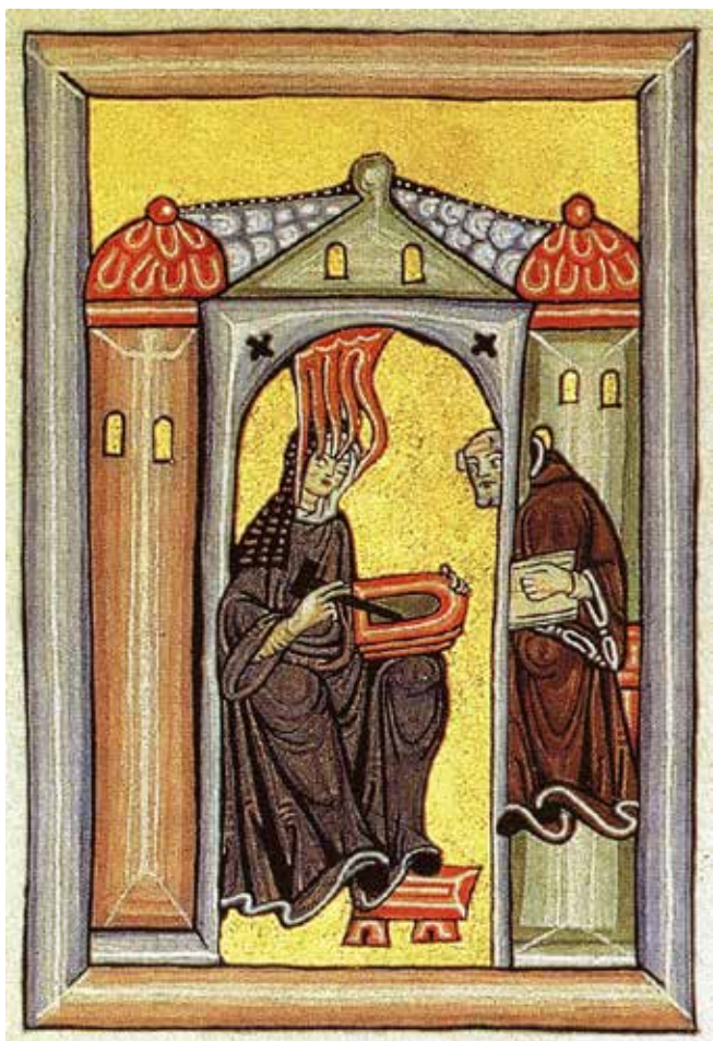
Hildegard von Bingen empfängt eine göttliche Inspiration und gibt sie an ihren Schreiber weiter. Miniatur aus dem Rupertsberger Codex des Liber Scivias.